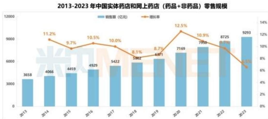
图表 4:2013—2023 年中国实体药店和网上药店(药品+非药)零售规模