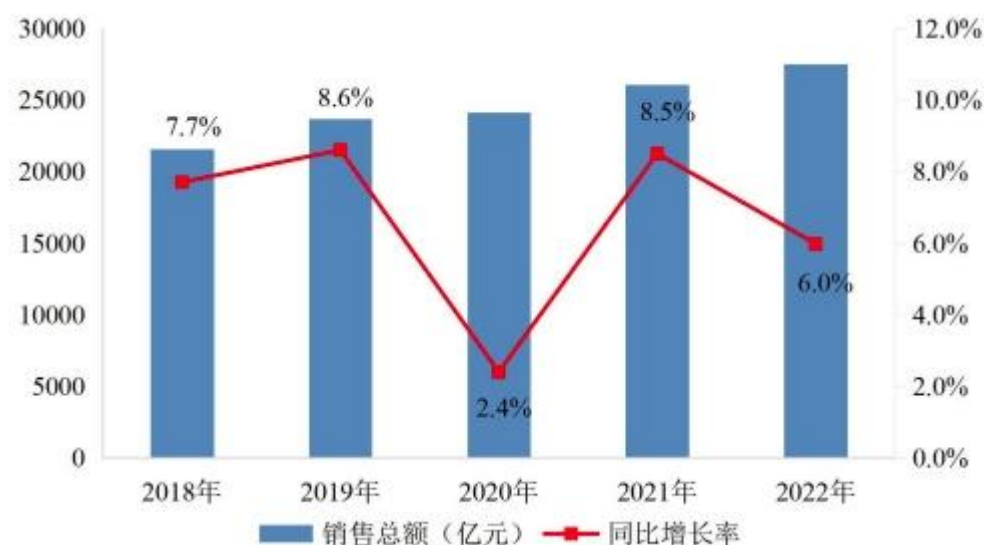
图表 2:2018—2022 年医药流通行业销售趋势（数据来源：商务部）

根据商务部数据，截至2022年末，全国共有《药品经营许可证》持证企业64.39万家，其中批发企业1.39万家，零售连锁企业6,650家、下辖门店36万家，零售单体药店26.33万家。全国七大类医药商品销售总额27,516亿元，扣除不可比因素同比增长6.0%，增速同比放缓2.5个百分点。