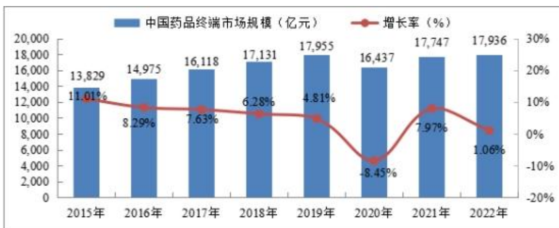
图表 1 2015—2022 年中国药品终端市场规模变化

全球经济的发展、人口总量的增长和社会老龄化程度的提高，使得市场对药品需求与日俱增，全球药品市场保持持续较快增长。作为全球医药市场的重要组成部分，我国医药行业凭借不断增长的经济实力以及逐渐完善的医疗体系，已成为全球医药消费大国。同时，我国社会医疗卫生费用支出的增加促进了全国医药行业发展。