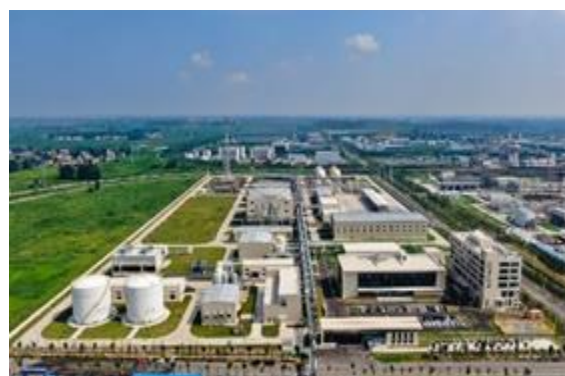
安徽凯泽新材料有限公司