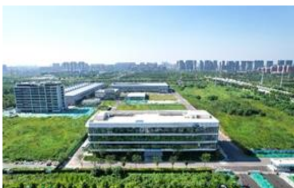
英科医疗智能医疗器械研发营销科技园