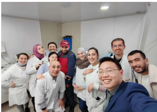
图为阳普医疗业务人员与合作伙伴开心合影

2023 年 2 月，公司携真空采血系统、智能实验室标本采集及管理整体解决方案等产品亮相 2023 阿拉伯国际医疗实验室仪器及设备展（Medlab Middle East），吸引了众多经销商与终端用户到我司展位参观拜访。