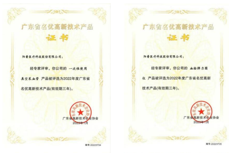
广东省名优高新技术产品证书

报告期内，公司主营产品“一次性使用真空采血管”及“血栓弹力图仪”被广东省高新企业协会评为“2022 年度广东省名优高新技术产品”。《广东省名优高新技术产品证书》的取得是对公司研发实力、持续创新能力、科技成果转化能力及企业成长性的肯定，有助于公司发挥战略优势，提升产品附加值，增加市场信任度，并形成持续创新机制。