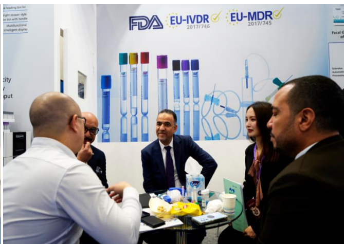
图为阳普医疗业务人员与终端用户及参观人员相谈甚欢