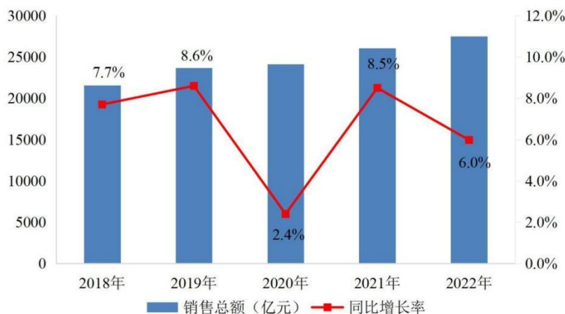
图 1：2018-2022 年药品流通行业销售趋势

行业数据方面，根据商务部 2023 年发布的《药品流通行业运行统计分析报告》显示，2022 年以来，全国药品流通市场销售规模有所扩大，全国七大类医药商品销售总额 27,516 亿元（含税），扣除不可比因素，同比增长 6%。其中，药品批发市场销售额为 21,526 亿元，扣除不可比因素同比增长 5.4%。