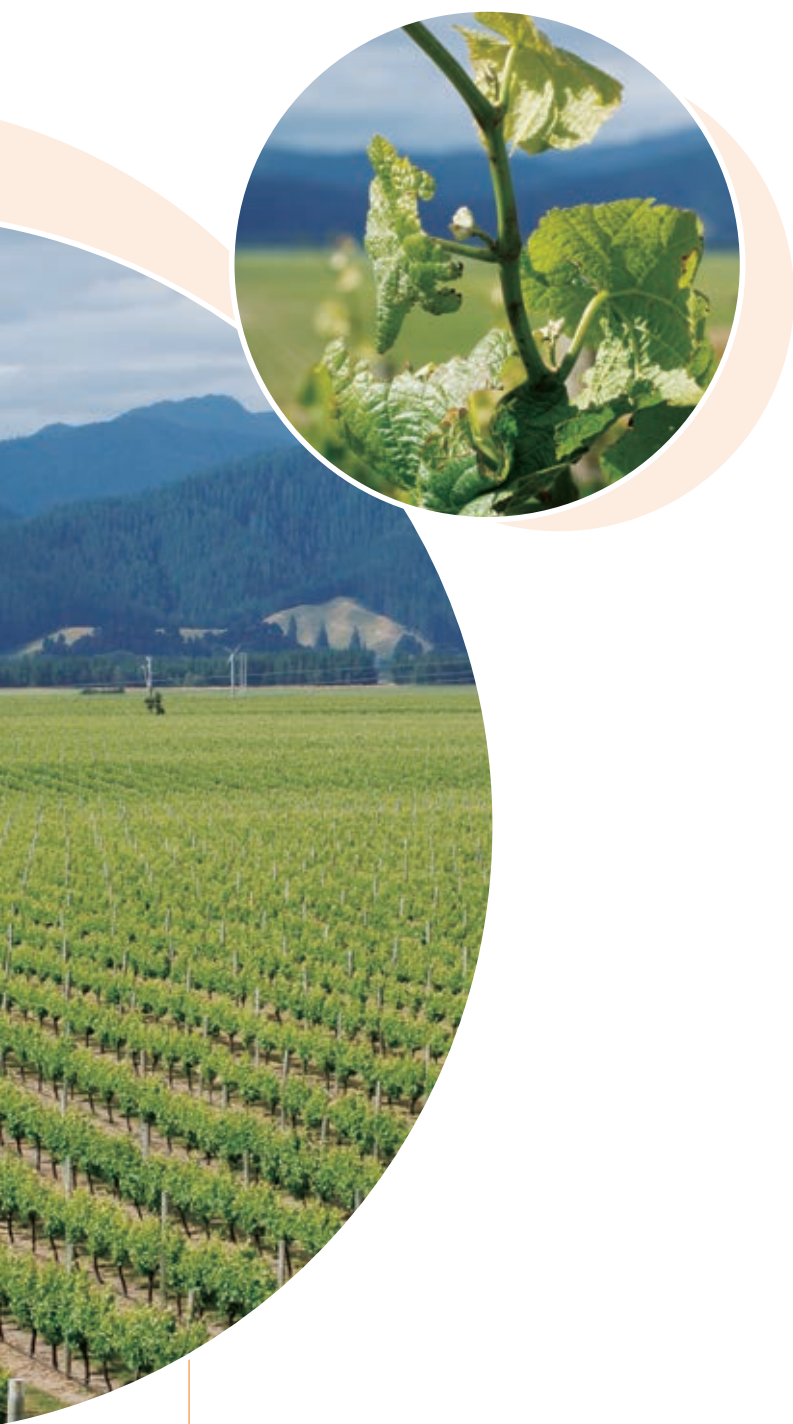
● 長江生命科技是澳紐地區的第二大葡萄園主，於澳洲及新西蘭分別擁有十九個及九個葡萄園。

於二零一三年收購的Northbank Millennium葡萄園位於新西蘭南島北部的Marlborough地區，佔地超過一百七十五公頃，總種植面積約一百三十公頃。Marlborough地區乃新西蘭最大的釀酒區，其產量佔全國總數的百分之七十七，被譽為世界頂級釀酒區之一。