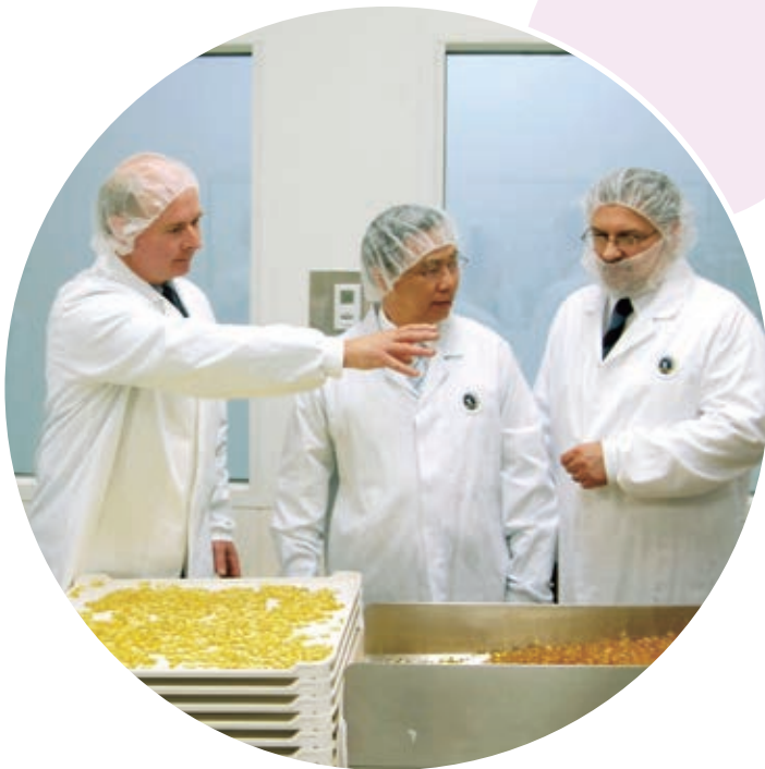
● Lipa 於澳洲保健產品市場的佔有率逾三成。