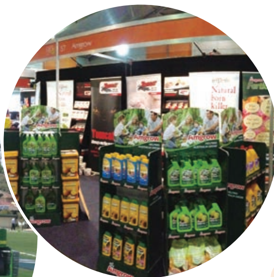
● 在澳洲，Amgrow 是當地最大草地保育產品及服務供應商、第二家居園藝產品供應商，以及第二大滅蟲管理產品及服務供應商。