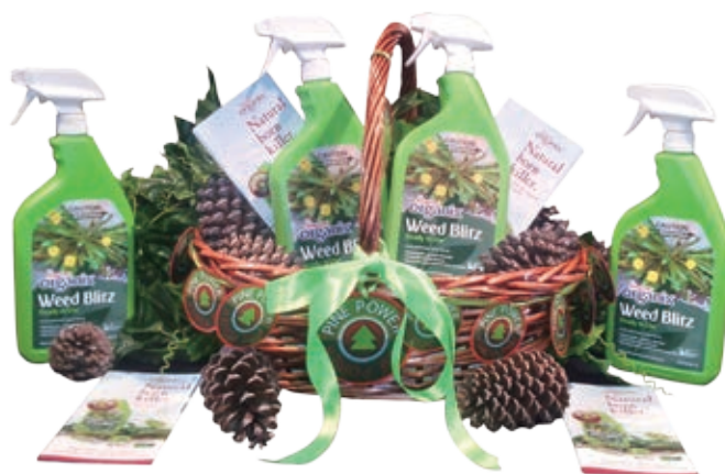
● Amgrow四大業務範疇包括家居園藝、農業／蔬果種植、專業草地保育及滅蟲管理。