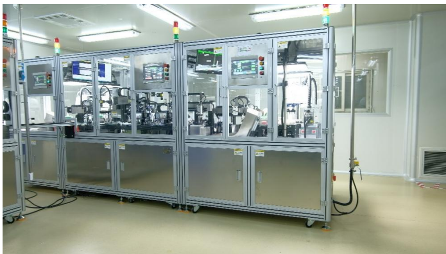
双机械臂全自动组卡机

在体外诊断领域，以“服务市场需求、制定精细计划、制造精准产品”为基本指导原则，努力提高生产效率、全面控制质量风险。今年上半年，我国的新冠肺炎流行呈现多点散发的特点，新冠抗原检测试剂的市场需求量大幅提升。公司凭借多年的技术储备和人才队伍，在获批国内上市的同时，改造半成品组卡和分装车间，加急采购近百台相应设备，迅速将月产能提升至近亿份，快速满足了市场需求，为迎接更大的挑战打下坚实基础。其它诊断试剂产品的生产，根据销售部门的预测，加强沟通协调、细化生产计划、加快流转速度，实现精益生产、精确核算、精准管理。持续开展 TPM 工作，生产效率和操作人员的工作面貌不断提升，通过对生产过程中无效损耗的控制等手段进一步控制成本，提升产品竞争力。