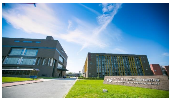
北京中关村生命园厂区