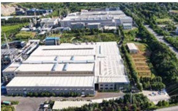
山东青州生产基地