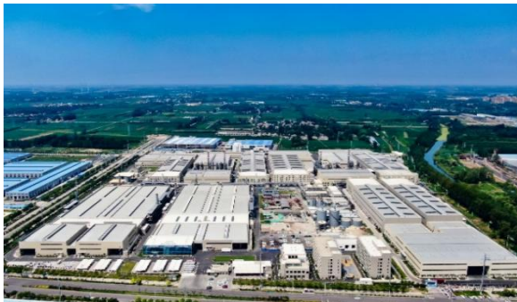
安徽淮北生产基地