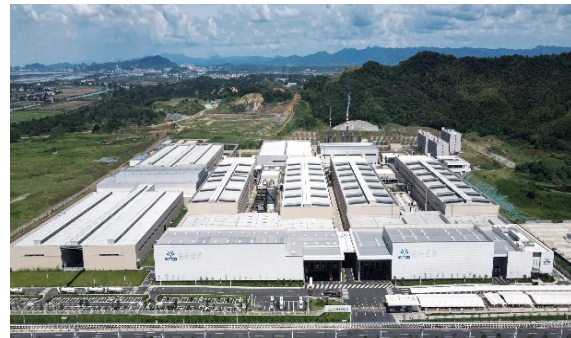
江西九江生产基地