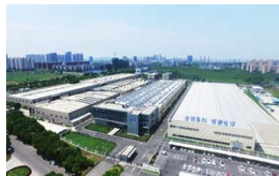
江苏镇江生产基地