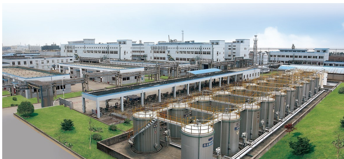
通过欧美官方认证的医药生产基地

公司在生产车间设计中融入“管道化、密闭化、自动化、信息化、连续化、可视化”理念，实现生产流程全程自动化控制，车间作业人员减少一半以上。生产现场积极推行精细化管理，合理安排各产品的生产能力，尽可能地提高设备利用率，合理控制成本，提升公司竞争能力。公司坚持走清洁化、绿色化的可持续发展道路，通过不断加大设备、工艺改造，强化现场安全管理和硬件设施投入，并推行清洁生产，从源头上减少三废的排放量。公司医药主要生产基地多次通过中国、美国FDA、欧盟EDQM、日本、巴西等国的现场审计，2017年10月川南药业更是以“零缺陷”通过了美国FDA现场检查。