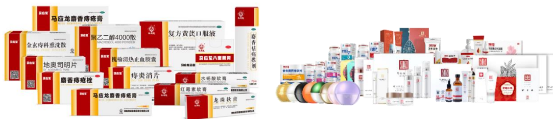
图：马应龙主要药品、大健康产品

医药工业逐步构建形成了以肛肠为核心，以眼科、皮肤等为支柱的产品格局，涵盖药品、大健康产品等。公司拥有国药准字号药品百余个，拥有马应龙麝香痔疮膏、麝香痔疮栓、马应龙八宝眼膏、龙珠软膏等独家药品 10 多个，生产剂型涵盖膏、栓、中药饮片、口服、片剂、洗剂等。大健康品类架构基于“械食卫妆消”全面涵盖功能性化妆品、功能性护理品、功能性食品、消械产品四大类，其中：功能性化妆品包含眼部护理、眼部日用品、面部及身体清洁与护理等产品；功能性护理品包括婴幼儿纸品、婴幼儿护肤品、女性用品等；功能性食品包括润肠促消化、补肾固本、膳食补充等产品；消械产品包含肛肠术后护理、日用电子辅助产品、眼部器械护理、消毒杀菌类产品，已上市 SKU 超过 400 余个，在研产品 100 余个。