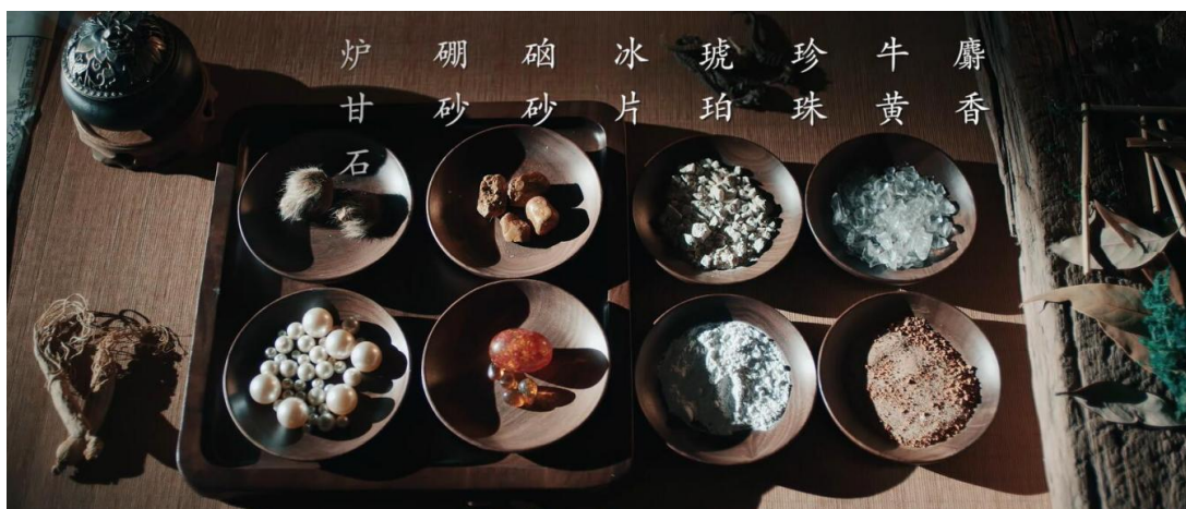
图：马应龙八宝名方

3、产品力优势。 马应龙持续经营四百余年，一方面得益于真勤理念的文化积淀，一方面得益于历久弥新的经典名方。马应龙名方包括麝香、牛黄、琥珀、珍珠、冰片、炉甘石、硼砂、硃砂等八味中药，又称八宝名方，具有清热解毒、活血消肿、去腐生肌的卓著功效。公司在八宝名方配伍的基础上，陆续研制推出了马应龙麝香痔疮膏、麝香痔疮栓、龙珠软膏和马应龙八宝眼霜等深受用户好评的产品。马应龙眼药制作技艺入选“国家非物质文化遗产名录”，马应龙治痔膏药获选工信部制造业单项冠军产品。