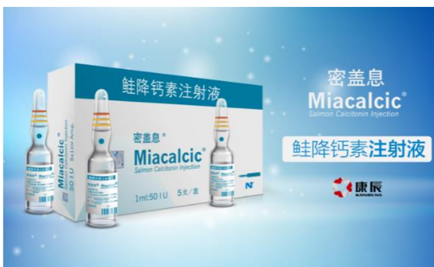
(密盖息鲑降钙素注射液)

2、“创新药研发”是公司一直坚持的核心战略，公司立足于填补临床上未满足需求的创新药研发及管线布局，创新药研发包括化药创新药、生物药创新药、中药创新药及宠物药赛道。目前，多项具有完全自主知识产权的全新多靶点药物正在有序地研发之中，具体如下：