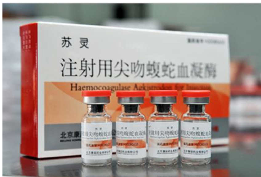
（国家一类新药尖吻蝮蛇血凝酶（商品名：“苏灵”））

（2）“密盖息”是防止急性骨丢失唯一有循证依据的药物，在骨质疏松降钙素细分领域具有领先的行业地位。