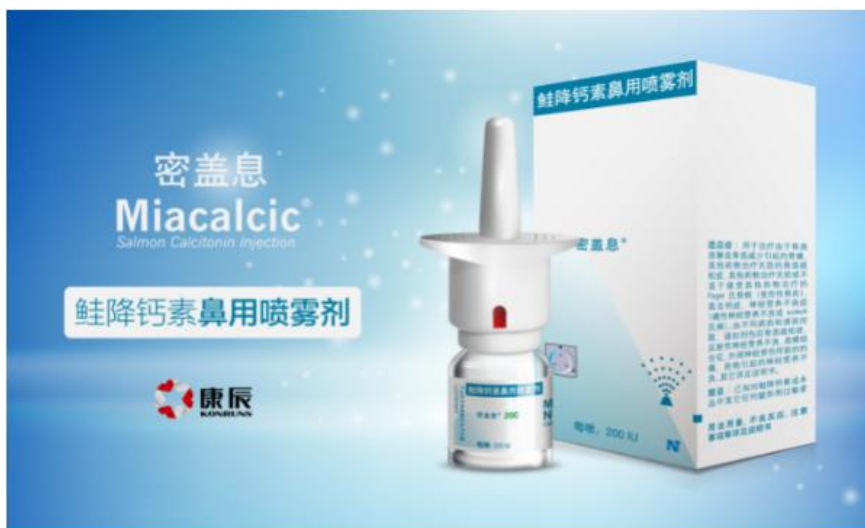
(密盖息鲑降钙素鼻用喷雾剂)