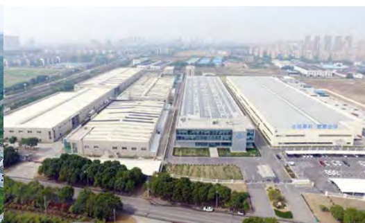
江苏镇江生产基地