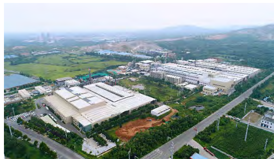
山东青州生产基地