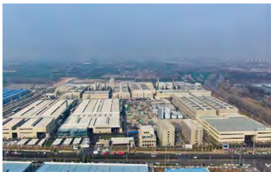
安徽淮北生产基地