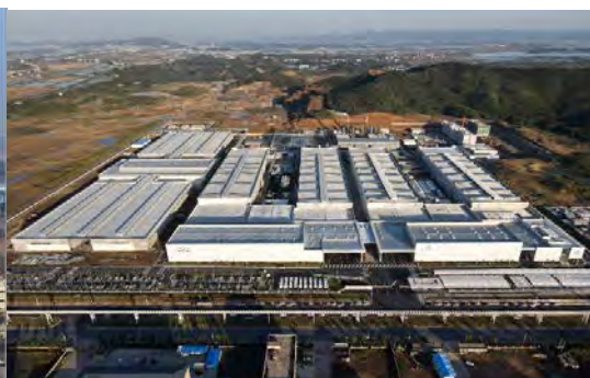
江西九江生产基地