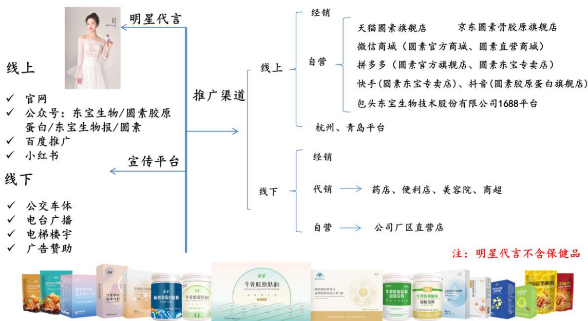
图7 “圆素”系列终端系列产品主要宣广渠道

并通过小红书、百度推广及线下多种方式进行品牌宣传。此外，公司大力开发团购业务，打造区域知名伴手礼品牌。报告期内，公司重点拓展了周边药店、美容院、便利店、特产店、商超等线下渠道，实现产品销售网络的区域普遍覆盖。后续，公司将密切关注动销情况，并全力提供市场营销方案、销售支持、人员培训和售后服务工作，争取实现新突破，创造中国“胶”傲。