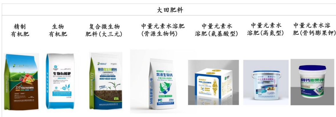
图 5 东宝大田产品列示