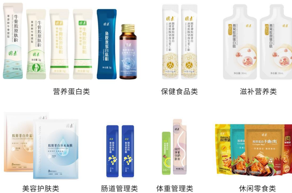
图 6-1 终端系列产品

公司零售系列产品自 2021 年开始升级上新，2022 年陆续推出系列新品，升级后的产品包括牛骨胶原肽粉、鱼胶原蛋白肽粉、胶原蛋白透明质酸钠维生素 C 粉、胶原蛋白肽蓝莓果汁饮品、胶原蛋白手撕肉、益生菌等，详见图 6-1、6-2。按照功能分类，公司产品覆盖保健食品类、营养蛋白类、滋补营养类、肠道管理类、体重管理类、美容护肤类、休闲零食类等，可满足不同年龄段人群的多样化健康需求。