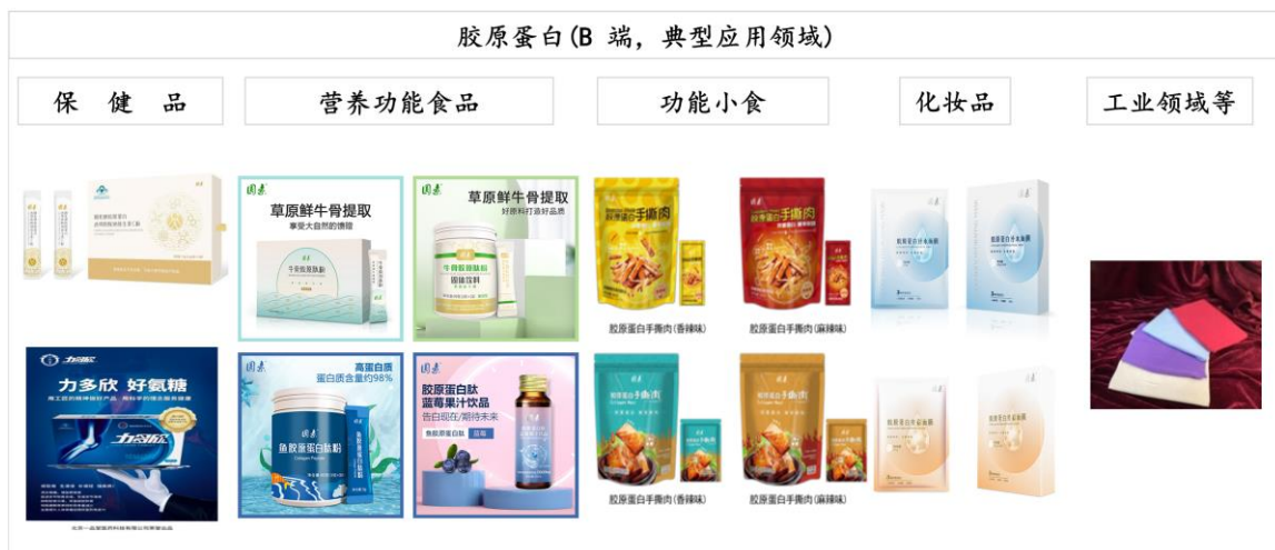
图 3 原料类胶原蛋白主要应用领域