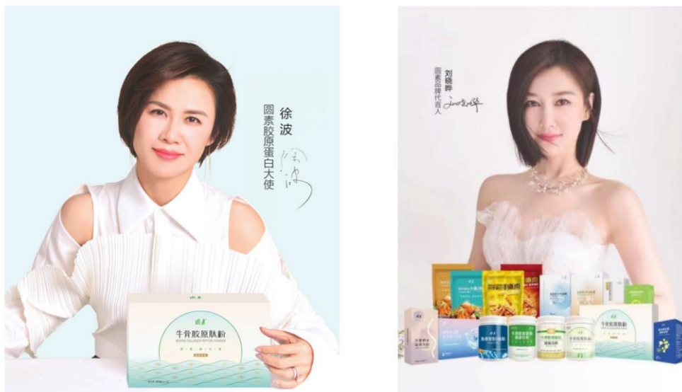
图 6-2 圆素品牌代言人、品牌形象大使(不含保健品)