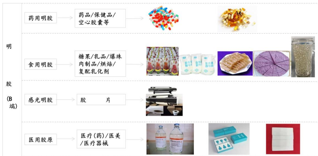
图 2 原料类明胶主要应用领域

子公司益青生物空心胶囊系列产品主要应用于药品、膳食营养补充剂领域，详见图 4。东宝大田的产品详见图 5。