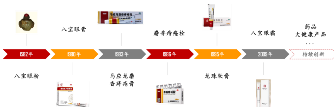
图：马应龙主要产品发展历程

马应龙创始于 1582 年，以眼药起家，拥有八宝名方。根据中医异病同治的原理以及马应龙八宝名方所具有的“清热解毒、活血化瘀、消肿止痛、祛腐生肌”的功效，20 世纪 80 年代以来，公司研发人员在八宝名方配伍的基础上，结合消费者的使用反馈，陆续研制推出了马应龙麝香痔疮膏、麝香痔疮栓、龙珠软膏和马应龙八宝眼霜等深受用户好评的产品（见下图）。公司以眼药起家，结合当时的市场竞争状况，选择聚焦肛肠领域，经过多年深耕，逐步构建了肛肠细分市场优势地位。2012-2015 年公司联合中华中医药学会肛肠分会开展了“中国成人常见肛肠疾病流行病学调查”，流调结果整体呈现“一高两低”特点，即发病率高、就诊率低和认知度低。由此判断，肛肠健康领域空间广阔，潜力巨大，任重道远。在此背景下，公司贯彻执行品牌经营战略，遵循“目标客户一元化，服务功能多元化”的发展思路，构建肛肠健康方案提供商，大力发展大健康产业，由原先的以药品治疗为主向全生命周期的健康管理延伸，涵盖预防、保健、诊断、治疗、康复，并逐步构建细分领域竞争屏障。目前已构建形成医药工业、医疗服务和医药商业的立体产业结构布局。