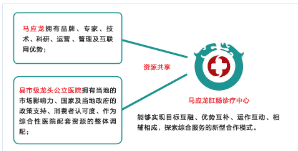
图：马应龙肛肠诊疗中心合作模式