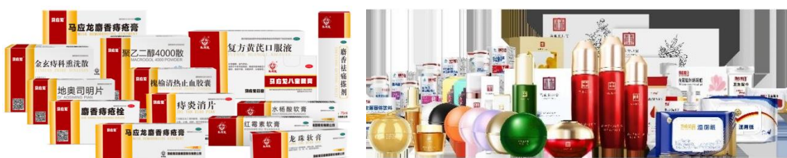
图：马应龙主要药品、大健康产品

大力发展眼美康业务，同时积极盘活皮肤用药，由皮肤治疗向皮肤健康护理延展，构建形成了以肛肠为核心，以眼科、皮肤等为支柱的产品格局，涵盖药品、大健康产品等。公司拥有国药准字号药品百余个，拥有马应龙麝香痔疮膏、麝香痔疮栓、马应龙八宝眼膏、龙珠软膏等独家药品 10 多个，生产剂型涵盖膏、栓、片剂、洗剂、中药饮片等。公司围绕肛肠健康、眼科健康、皮肤健康等，积极拓展大健康业务，基于“械食卫妆消”全面涵盖功能性化妆品、功能性护理品、功能性食品、消械产品四大类，其中：功能性化妆品包含眼部护理、眼部日用品、面部及身体清洁与护理等产品；功能性护理品包括婴幼儿纸品、婴幼儿护肤品、女性用品等；功能性食品包括润肠促消化、补肾固本、膳食补充等产品；消械产品包含肛肠术后护理、日用电子辅助产品、眼部器械护理、消毒杀菌类等。