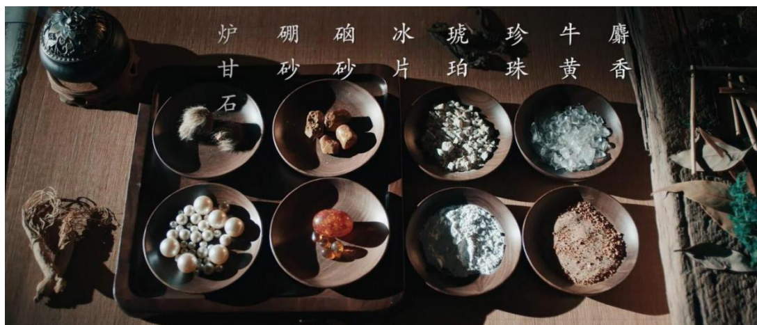
图：马应龙八宝名方

3、产品力优势。马应龙持续经营四百余年，一方面得益于真勤理念的文化积淀，一方面得益于历久弥新的经典名方。马应龙名方包括麝香、牛黄、琥珀、珍珠、冰片、炉甘石、硼砂、硃砂等八味中药，又称八宝名方，具有清热解毒、活血消肿、去腐生肌的卓著功效。公司在八宝名方配伍的基础上，陆续研制推出了马应龙麝香痔疮膏、麝香痔疮栓、龙珠软膏和马应龙八宝眼霜等深受用户好评的产品。马应龙眼药制作技艺入选“国家非物质文化遗产名录”，马应龙治痔膏药获选工信部制造业单项冠军产品。